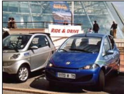
EVS21: Probefahren der E-Mobile vor dem Grimaldi Kongress Zentrum im Monaco

2005-04: „EVS21“ in Monaco (R. Reichel, siehe dazu Kurzbeitrag in den Solarmobil Mitteilungen Nr. 57 vom Juli 2005, Seite 19)