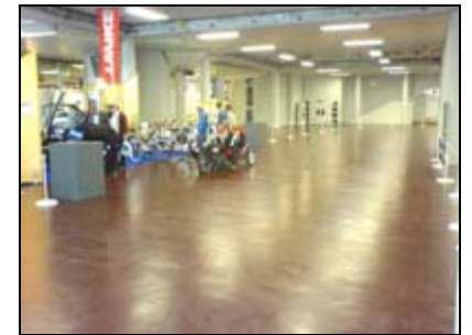
Viel Platz zum Probefahren auf der eltefa