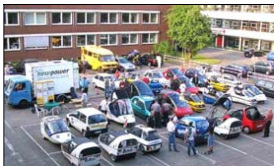
T.d.R. Teilnehmer in Münster, links die bsm-Stromtankstelle

2005-07: Tour de Ruhr (Teilnahme: R. Reichel), Stromtankstelle (T. Ruschmeyer)