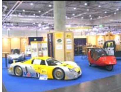
bsm Präsentation auf der AMI in Leipzig

02.-10.04 AMI in Leipzig Auto-Salon in Ostdeutschland bsm-Sonderschau auf ca. 200qm, besondere Exponate: Jetcar Energiesparauto, das mit 2,1 L Diesel auf 100 km zur Zeit energiesparendste Auto, und der OPEL Speedster ECO, eine „Rennmaschine“ mit nur 2,5 l/100 km Diesel-Verbrauch.