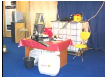
Pflanzenöl Presse auf der AMI

5.-7.05. Clean Energy Expo, London Vortrag und Ausstellung ( R. Reichel )