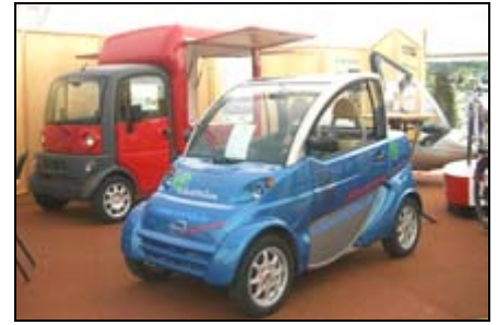
MEGA und Startlab OPEN auf der Soltec

01.-04.09 SOLTEC in Hameln Solar- und Energie-Fachmesse bsm-Sonderschau auf 120qm