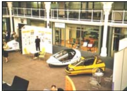
TWIKE und CityEl auf dem bsm Stand in London

5.-7.05. Clean Energy Expo, London Vortrag und Ausstellung ( R. Reichel )