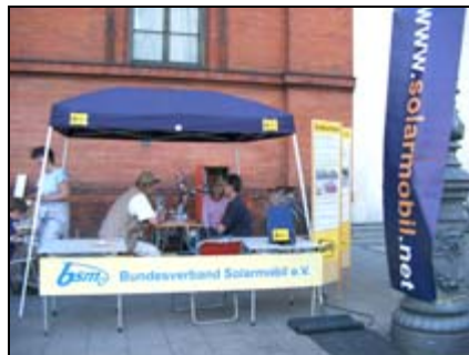
bsm Infostand auf der Solarparade München

2005-06: Solarparade München (R. Reichel, T. Ruschmeyer)