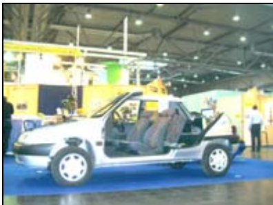
SAXO mit Hybridantrieb der FH-Zwickau