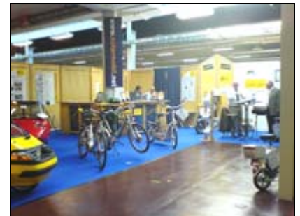
bsm auf der eltefa in Stuttgart

21.-23.09 eltefa in Stuttgart Elektrofachmesse, bsm-Sonderschau und Probefahren