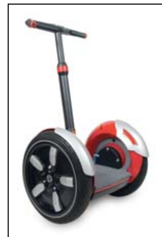
Eins der neuen segway Modelle

Leicht-Mobile: Elektromobile: der neue Start Lab aus Italien, MEGA, neuer Leichttransporter aus Frankreich. Diesel/Pflanzenöl bzw. Benzin: JetCar, das spektakuläre und schnelle zweisitzige Leichtmobil, ein privates SAM-Dreirad sowie TWIKE und CityEl, Renault Kangoo électrique RE.