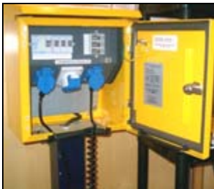
Park & Charge Stromtankstelle

Solar und Energie, Solarboote und Sonstiges: Solar-Trak zeigt seine solare, autarke Straßenleuchte, Kopf Solarboot SOL10, LESA Heissdampfmaschine, und dazu wird SECCO Solar gereicht.