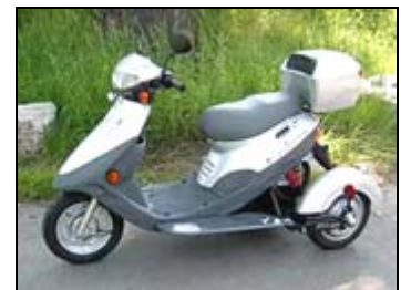
EVT Trike mit zwei Radnabenmotoren

Elektro-Zweiräder: SWIZZBEE aus der Schweiz und der neue E-Roller HELIO aus den USA, EVT Roller (jetzt auch dreirädrig), segway