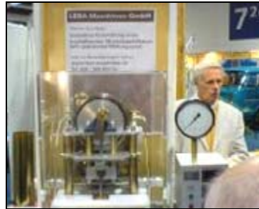
LESA Heissdampfmotor – Demonstration, hier bei einer Demonstration auf der Solar Energy Messe Febr. 2006 in Berlin

Bücher und Zeitschriften: "Solarmobil" Fachzeitschrift für Solare Mobilität und umweltfreundlichen Verkehr Photon Special, Sonderheft 2006/2007 Netzgekoppelte Solarstromanlagen und andere ausgewählte Photon und andere Zeitschriften, Das grüne Branchenbuch