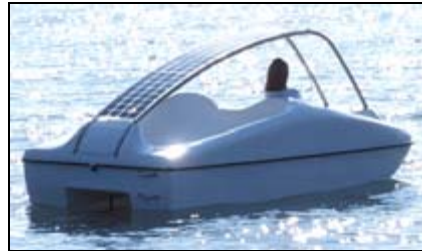
Kopf Solarboot SOL 10

Solar und Energie, Solarboote und Sonstiges: Solar-Trak zeigt seine solare, autarke Straßenleuchte, Kopf Solarboot SOL10, LESA Heissdampfmaschine, und dazu wird SECCO Solar gereicht.