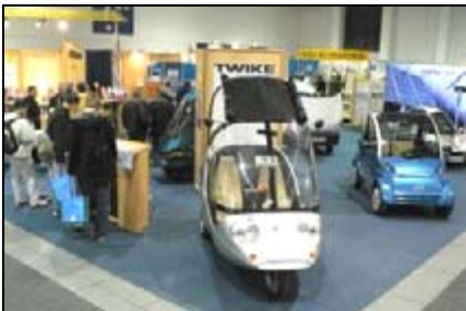
bsm Sonderschau, hier in Berlin

Die "RENEXPO(r)" - Internationale Kongressmesse für Regenerative Energien - findet vom 28.09. -01.10.2006 in der Messe Augsburg statt. Ob Biogasanlagen, BHKW - mit Kraftwärmekopplung, Pflanzenöl und seine energetische Nutzung, Solarenergie, Wasserkraft oder Wärmepumpe - bis hin zur Zelle der Photovoltaikanlage, alle Bereiche sind vertreten.