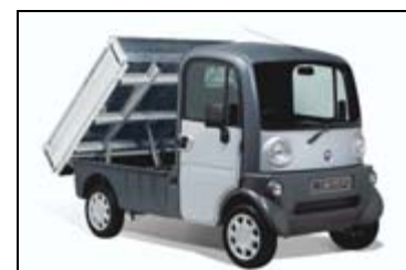
Mega Klein LKW, hier mit Kipper Aufbau

Leicht-Mobile: Elektromobile: der neue Start Lab aus Italien, MEGA, neuer Leichttransporter aus Frankreich. Diesel/Pflanzenöl bzw. Benzin: JetCar, das spektakuläre und schnelle zweisitzige Leichtmobil, ein privates SAM-Dreirad sowie TWIKE und CityEl, Renault Kangoo électrique RE.