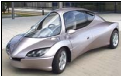
JetCar, zweisitziges Energiesparauto

Bio-Kraftstoffe: SAAB Bio Power Fahrzeug mit E85, VW Golf III Variant Turbo Diesel mit Wolf-Pflanzenöl Umbau (Eintank System)