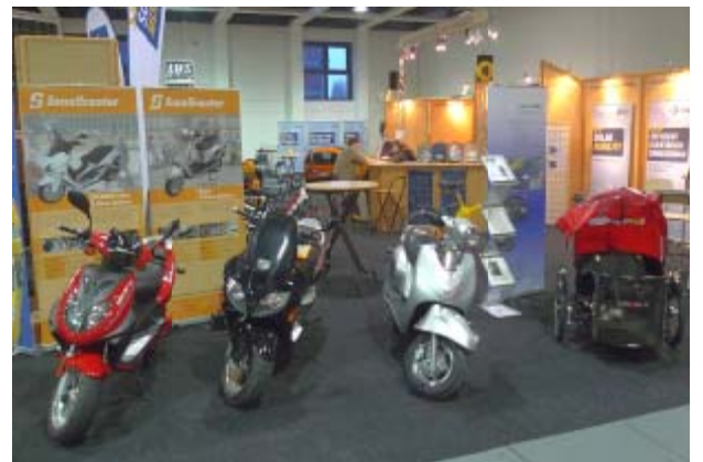
Die Innoscooter Roller, im Hintergrund der BSM Infotresen