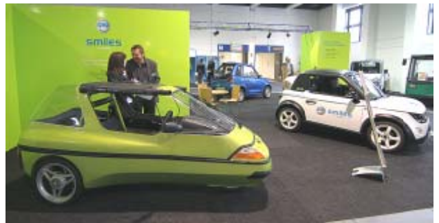
Die SMILES AG mit dem CityEL, einem REVAi und einem Tazzari ZERO