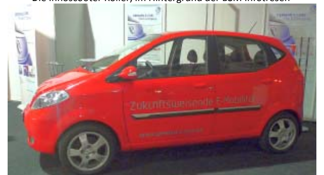
Der Benni von German-E-Cars