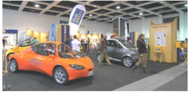
Startlab Open, Jetcar und der SMART, daneben die Park&Charge Präsentation