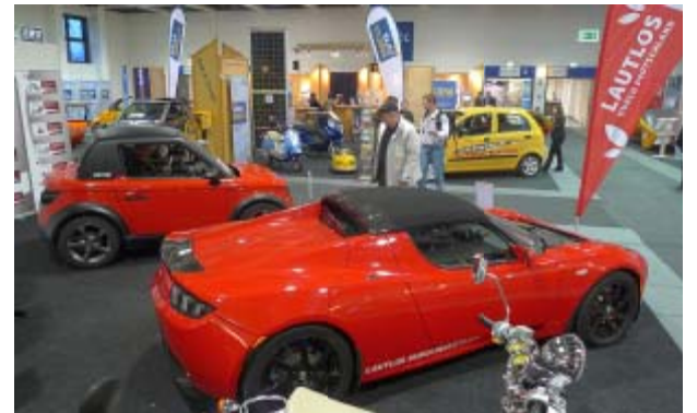
Lautlos-durch-Deutschland mit Tazzari Zero, TESLA und Zweirädern. Im Hintergrund der CitySax aus Dresden